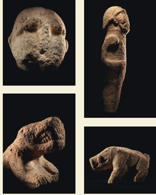
Göbekli Tepe kazılarında çıkarılan heykellerden bazıları

Kazıları şu anda Alman Arkeoloji Enstitüsü ile Türkiye Cumhuriyeti Kültür ve Turizm Bakanlığı birlikte sürdürüyor.