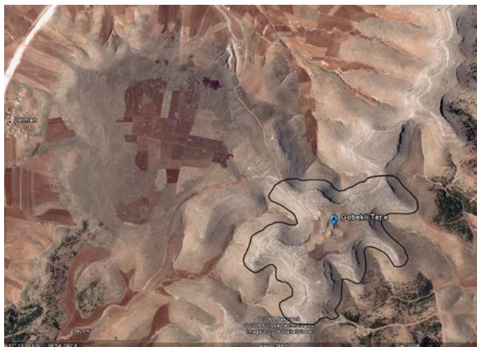
Göbekli Tepe'nin Google Maps'ten alınmış görüntüsü